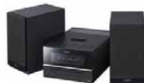
La Joueur/Radio de Bassin/Cd d'iPod de CMTBX201 de Sony a suggéré le détail 199,99$